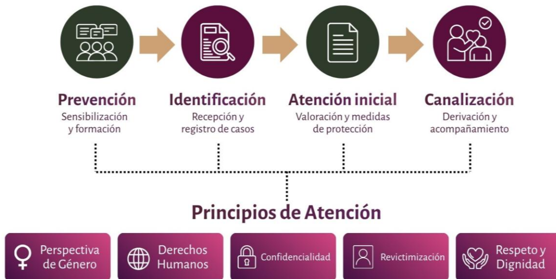
Diagrama de elaboración propia, con información del presente instrumento.