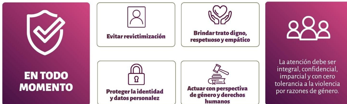
Diagrama de elaboración propia, con información del presente instrumento.